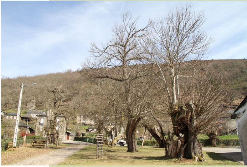
Souto de Rao