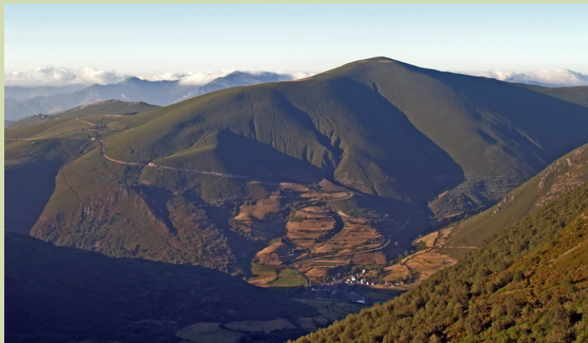
Vista desde o Porto de Ancares sobre Balouta e o pico do Cinsó.