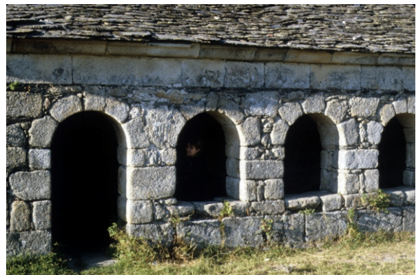
Detalle da igrexa de Suárbol.