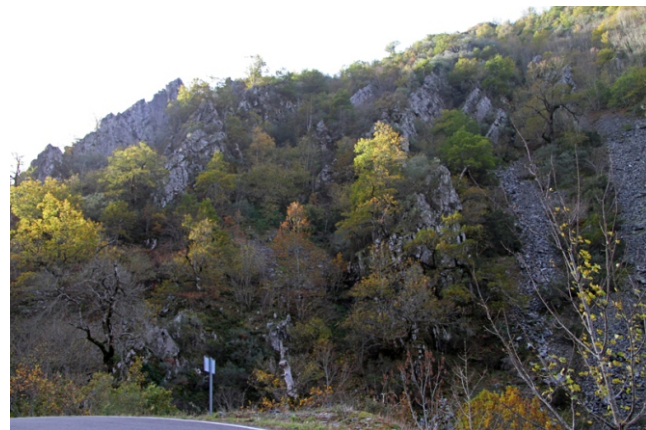
Canón do Rao