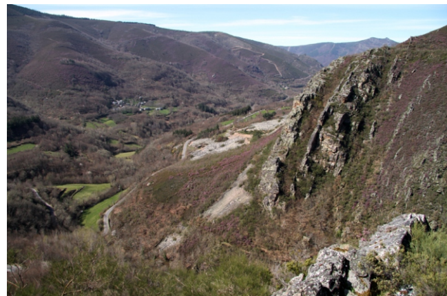
O Penedón desde o miradoiro de Pena Aveado, sobre o canón do Rao