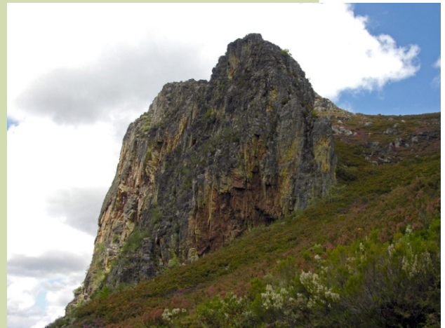
Penedo de Murias