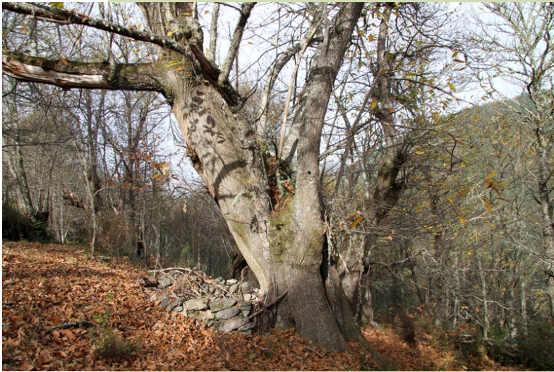
Castiñeiro e ouriceira no souto da Saencia (Rao)