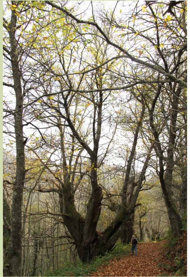
Castiñeiro de 8,40 m de perímetro no souto da Saencia (Rao)