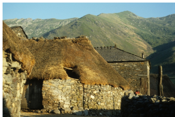
Balouta (imaxe de 1987)