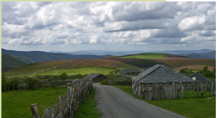
Brañas de Pan de Zarco